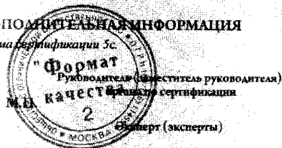
Схема сертификации 5с.

Руководитель (ответственный руководитель) М.П. Руководитель органа по сертификации